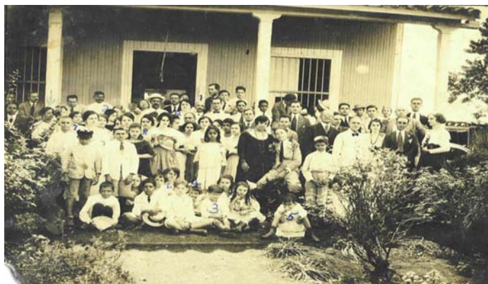
Foto tomada en Colón, Matanzas, noviembre 17 de 1919.

QUISIÉRAMOS que estas fotografías de la Sociedad Espiritista de Colón encontradas recientemente sirvan de homenaje a este grupo de personas que con tanto amor y dedicación se esforzó por ayudar al prójimo divulgando la buena noticia de las ideas espiritistas en Cuba.