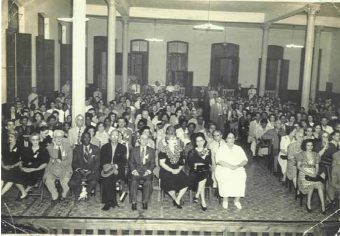
Velada de clausura del Congreso Espiritista Cubano (1946).

Velada de clausura del Congreso Espiritista Cubano, en la noche del 31 de Marzo 1946, en los salones del la Sociedad Curros Enríquez, Calzada de Santos Suárez, La Habana.