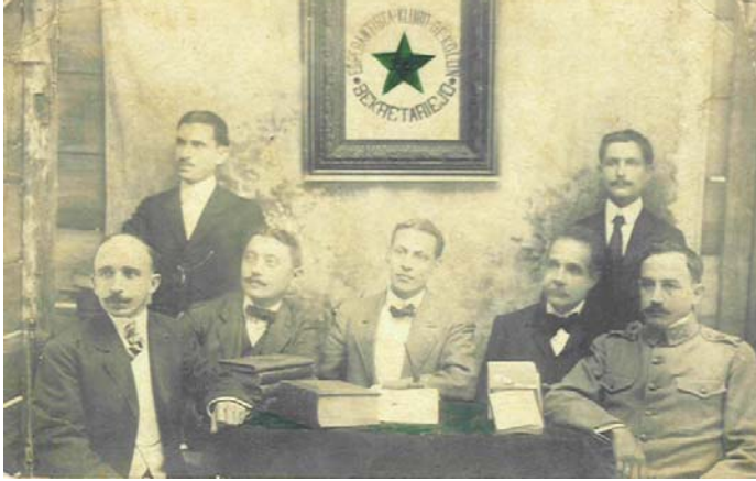
Grupo Esperantista de Colón, Matanzas (1916).

El Grupo Esperantista de Colón, Matanzas, formaba parte de la Sociedad Espiritista Cubana y propugnaba por el idioma esperanto como lengua universal auxiliar para impulsar las ideas espiritistas mundialmente.